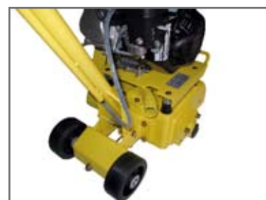
Uttag för dammsugare